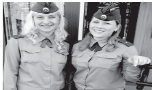
Лагерные сборы в Терпелке были испытанием на прочность.

Вчерашние курсанты, нынешние сотрудники института, поражаются, как быстро развивается наш вуз: в два раза увеличилось число кафедр, осуществляется переход на факультетскую систему, крепнут «тылы» – материальная база института. И гордятся своим альма-матер... Инна МАКЕДОНСКАЯ.