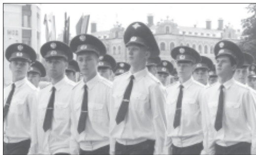
Вот он, долгожданный выпуск!