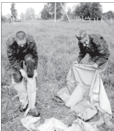
Сто одежек и все с застежками.

Материал подготовили Илья ЛЕВИНСКИЙ, Инна МАКЕДОНСКАЯ.