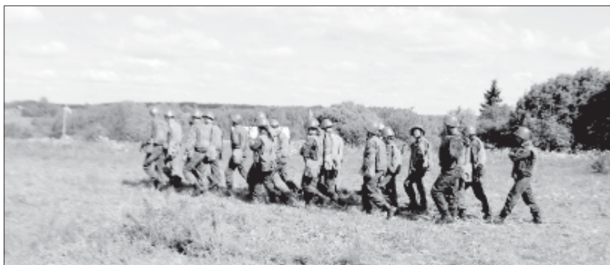
«Я уходил тогда в поход...»

Выпуск 4 (15 июня 2007 года) Учредитель ВИПЭ ФСИН России Редактор Инна Македонская Корректоры Ольга Бобошина, Ирина Головина Дизайнер Ирина Кузнецова