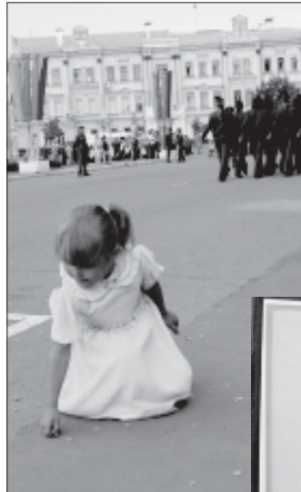
Монетка на память. «Я тоже буду учиться в ВИПЭ?»

Материалы подготовили Инна МАКЕДОНСКАЯ, Виталий БЛИЗНЮК.