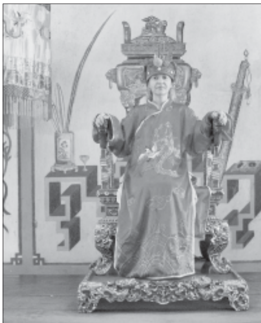
На троне вьетнамского императора.