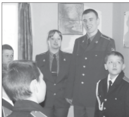
Курсанты – лучшие друзья кадетов.