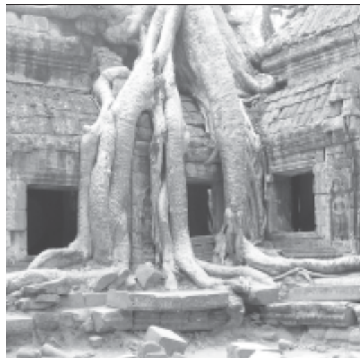
Камбоджа. Храм Та Пром.