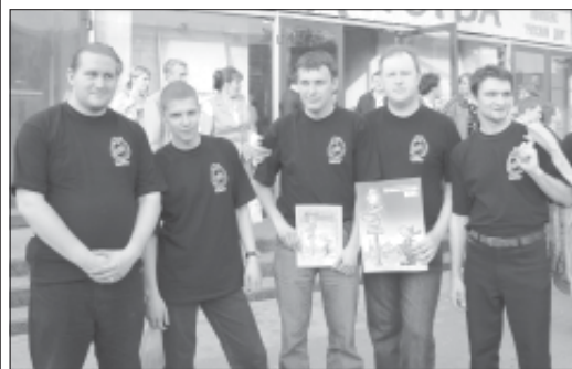
Вологодская команда «Удача», занявшая в брейн-ринге третье место.