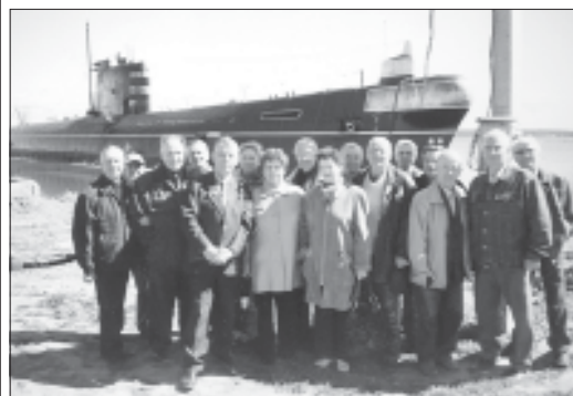
Ветераны побывали в музее подводной лодки.