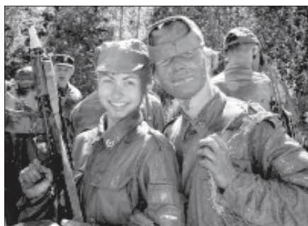
«Это мы-то слабый пол?»