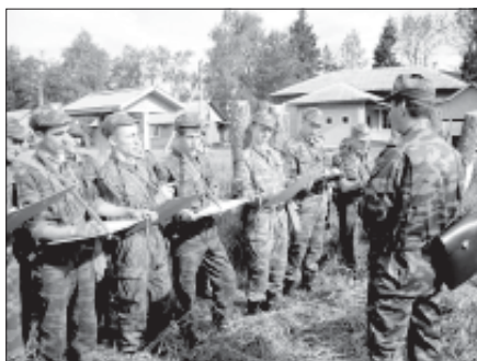
«Вы шли по азимуту или «на авось»?»