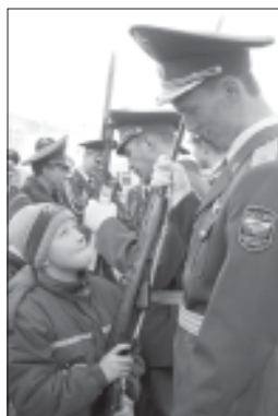
Есть на кого равняться.

Так курсанты факультета шефствуют над детским домом № 1 г. Вологды: проводят с воспитанниками правовые беседы, организуют военизированные эстафеты, экскурсии, встречи с вологодскими милиционерами, ветеранами, праздничные концерты. Кроме того, наши курсанты активно включились в шефскую помощь Вологодской областной кадетской школе-интернату: выступают с концертами, проводят для кадетов экскурсии по институту. В начале июня в Соколе были проведены занятия с кадетами по вопросам жизнеобеспечения в экстремальных условиях: ребят учили ориентироваться на местно-