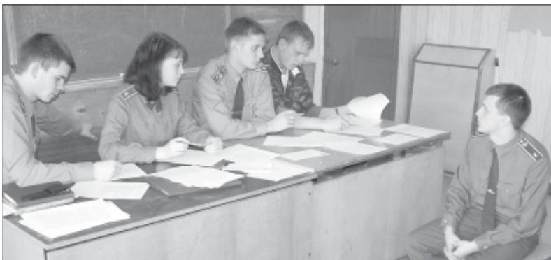
Строгая приемная комиссия.

Не за горами тот день, когда эти радостные слова услышит каждый из нас. Впрочем, принять участие в конкурсе на замещение вакантных должностей самых солидных организаций региона можно, будучи курсантом. «Это незаконно!» – возмутятся юристы. А я отвечаю: «Не торопитесь с выводами!»