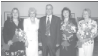
Дружный коллектив сотрудников.

В соответствии со статьей 29 Закона Российской Федерации «О высшем и послевузовском профессиональном образовании» и в целях более полного использования возможностей учебного заведения по подготовке специалистов с высшим юридическим образованием в институте в июне 2000 г. было открыто отделение платных образовательных услуг. Два года спустя отделение преобразовали в факультет внебюджетного образования (ФВО). В июне факультет отмечает свой пятилетний юбилей.