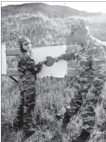
Не в бровь, а в глаз...