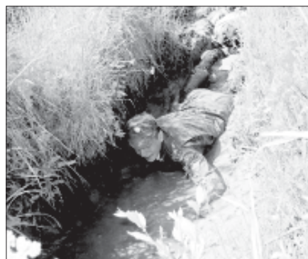
А вам слабо?»