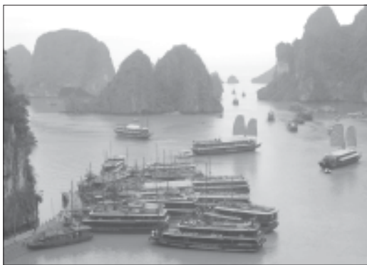
Залив тысячи островов.

Пятое. Находясь за границей, не забывайте: жулики, специализирующиеся на иностранцах, работают без выходных. Берегите кошелёк. В аэропортах и гостиницах, в базарной толчее — постоянное внимание и никому не доверяйте. Если не знаете, где можно надежно спрятать деньги, попробуйте оставить их на ресепшене. Впрочем, иной раз в надежности такого хранения тоже сомнева-