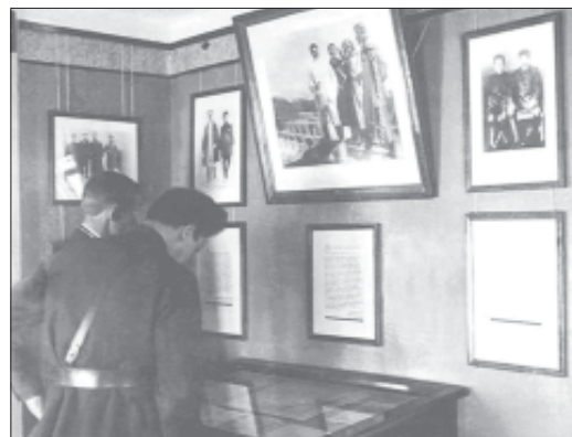
В 1937 году в Вологде, в доме, где, находясь в ссылке, жил И.В. Сталин, организован мемориальный музей. Фотография 1938 года.