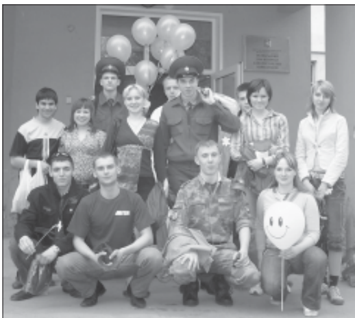
После концерта в Доме престарелых.