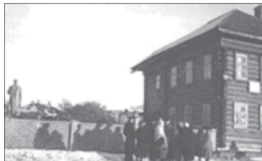
Дом-музей И. В. Сталина (ныне дом по улице М. И. Ульяновой, 35). Фотография 1946 года.