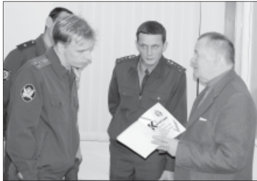
На встрече с научным руководителем.

Основная цель адъюнктуры — обеспечение учебного заведения собственными научными-педагогическими кадрами высшей квалификации. Институт организует подготовку адъюнктов по трем научным специальностям: «12.00.08. Уголовное право и криминология; уголовно-исполнительное право»; «12.00.11. Судебная власть, прокурорский надзор, организация правоохранительной деятельности, адвокатура»; «19.00.06. Юридическая психология». В 2008 г. планируется открытие четвертой специальности — «12.00.09. Уголовный процесс, криминалистика и судебная экспертиза; оперативно-розыскная деятельность». Темы диссертационных исследований отвечают основным направлениям научных исследований в ФСИН России.