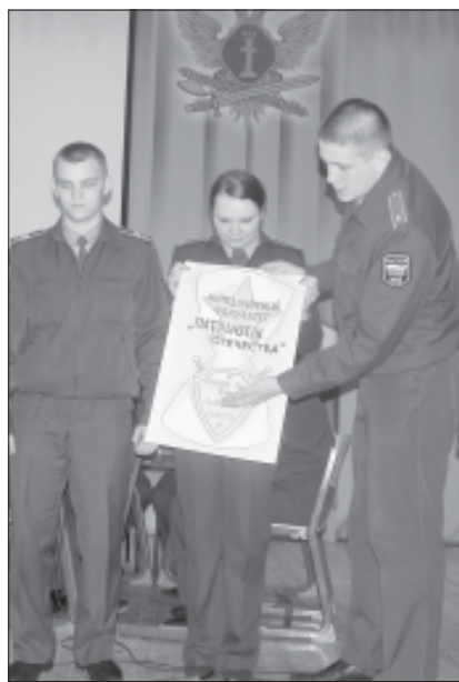
Лидируют «Патриоты Отечества».

Александр КУЗЬМИНЫХ.